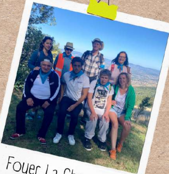
Foyer La Chevanière