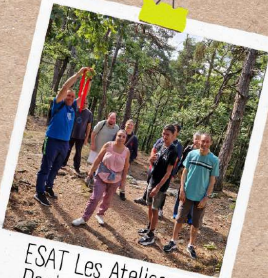
ESAT Les Ateliers Denis Cordonnier