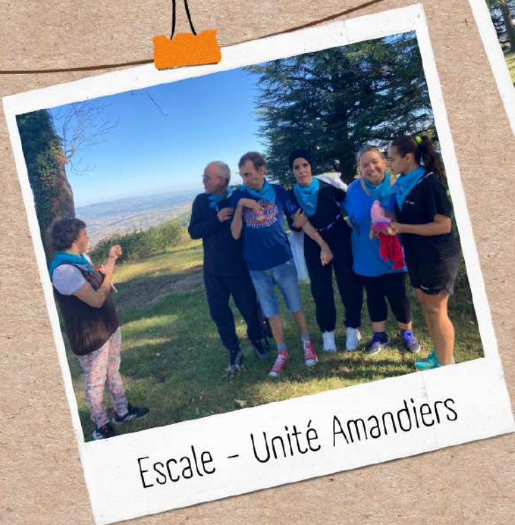
Escale - Unité Amandiers