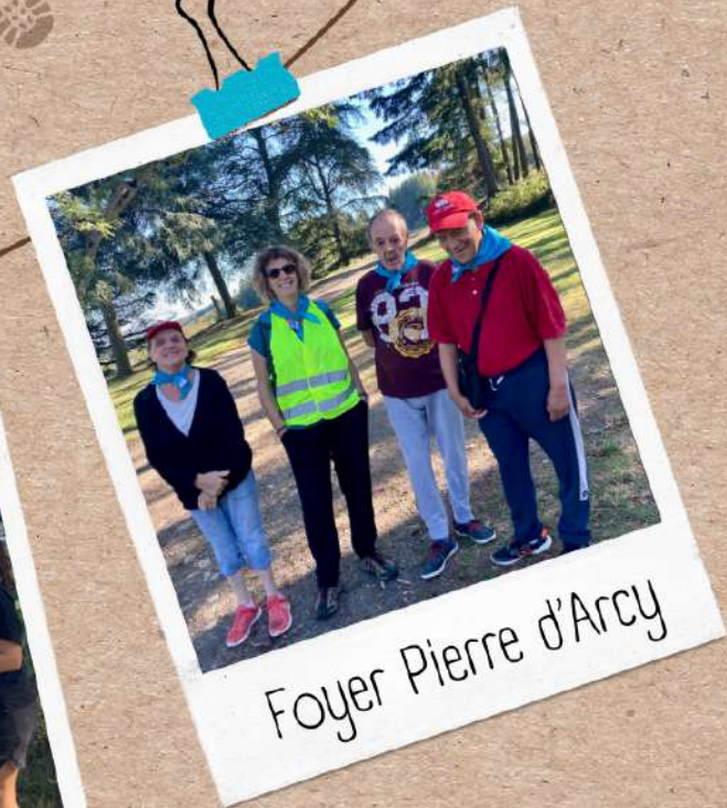
Foyer Pierre d'Arcy