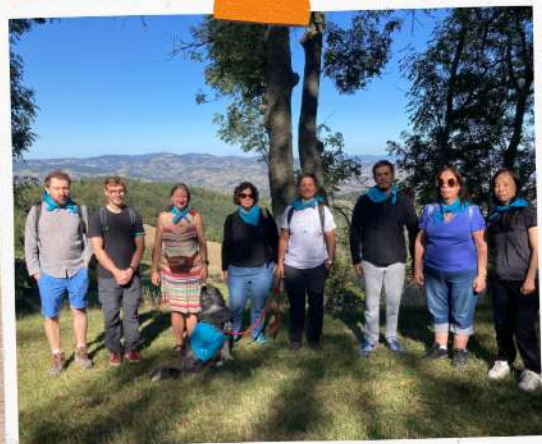
CSA Lyon 7

“L'organisation était super.” “Ça nous fait tous du bien de sortir.”