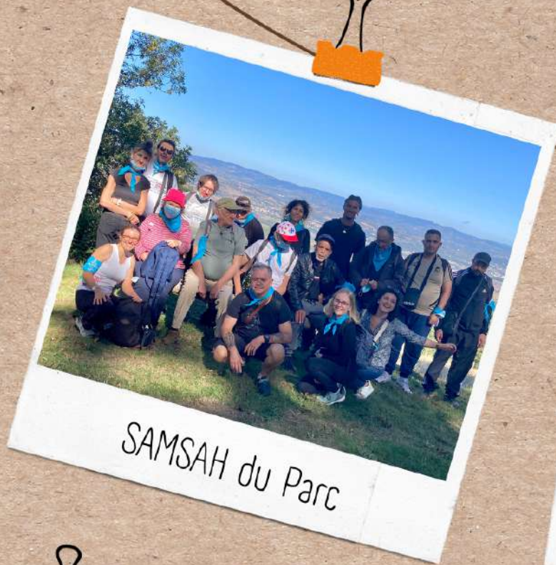
SAMSAH du Parc