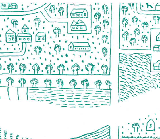
Carte graphique réalisée par l'Atelier Pers.